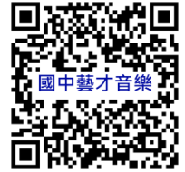
桃園市國民中學藝術才能音樂班 鑑定線上報名系統

(一)管道二(競賽表現優異入學)：112年3月24日(星期五)18：00前公告審查結果。