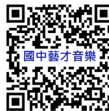
桃園市國民中學藝術才能音樂班 鑑定線上報名系統