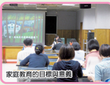
家庭教育的目標與意義