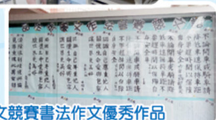
語文競賽書法作文優秀作品