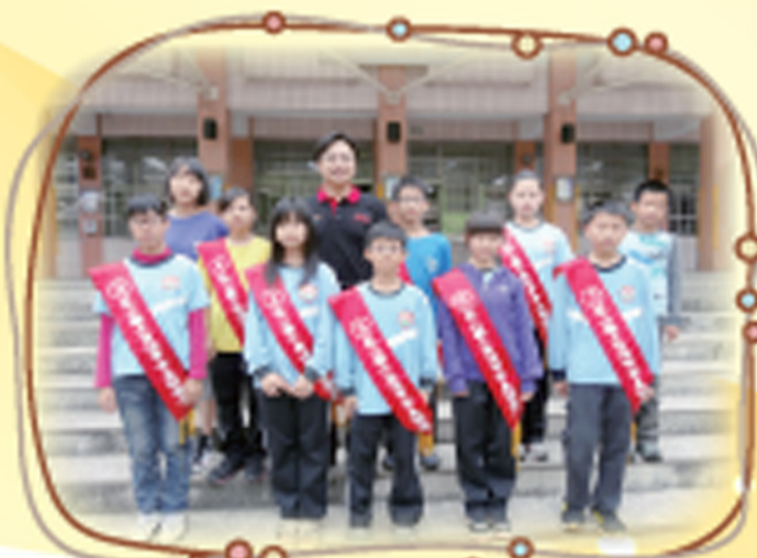
第21屆自治市長各級候選人和校長合影