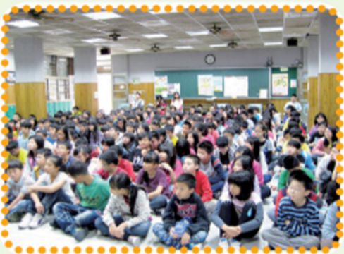
畢業生個個專注聆聽師長的介紹