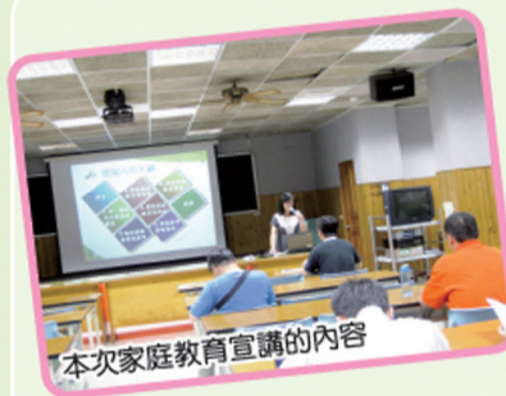
本次家庭教育宣講的內容