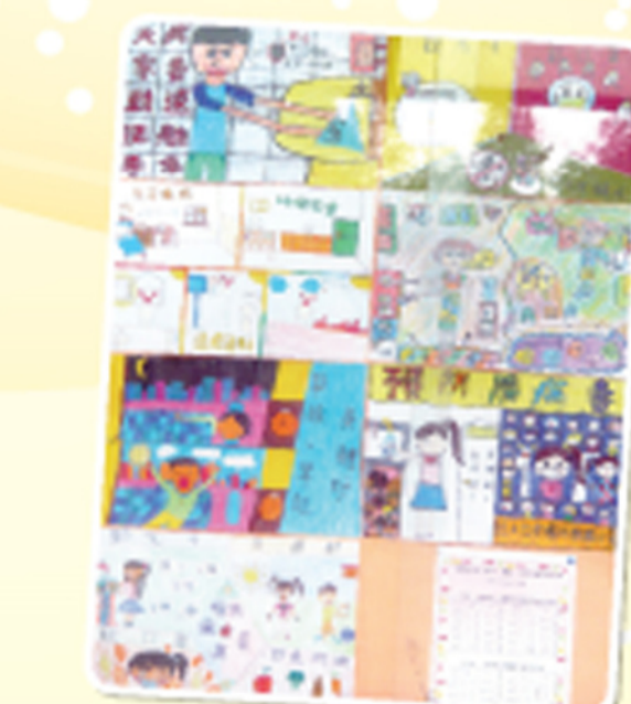
傳染病宣導比賽得獎作品