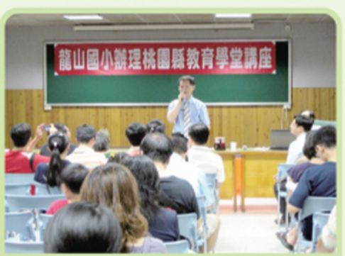
謝執行長親臨勉勵家長