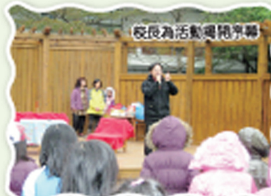
校長為活動揭開序幕