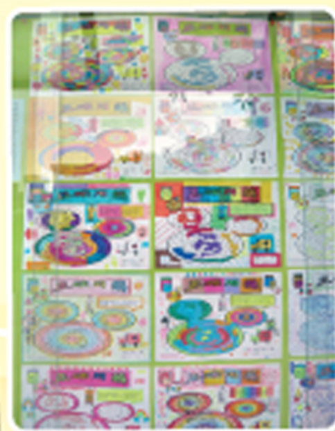
正確用藥宣導比賽得獎作品