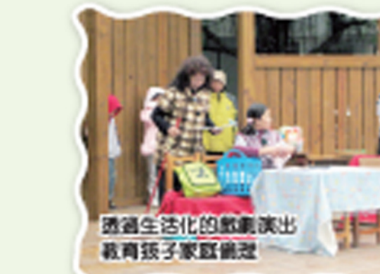
透過生活化的戲劇演出 教育孩子家庭價值