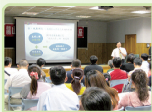
教授為大家說明十二年國教入學方式與特色