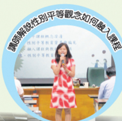
講師解說性別平等觀念如何融入課程