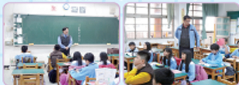
攜手計畫班101學年度第二期開班，校長勉勵同學們努力學習