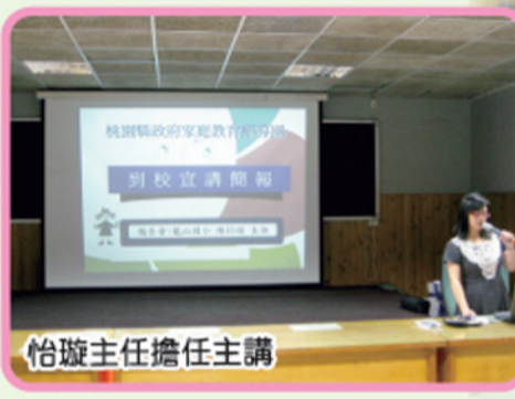
怡璇主任擔任主講