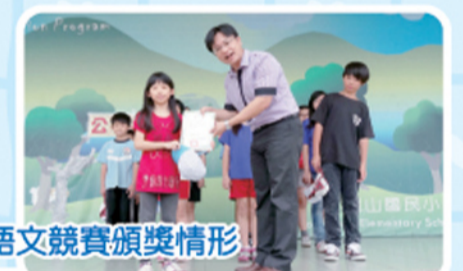
語文競賽頒獎情形