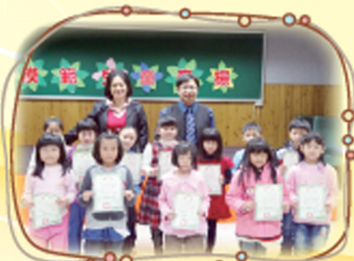
模範生和校長、家長會長合照留影