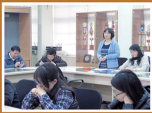
資源班教師說明教學情形