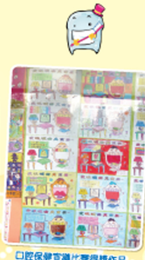
口腔保健宣導比賽得獎作品