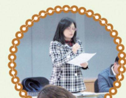
輔導主任報告 特推會執行任務