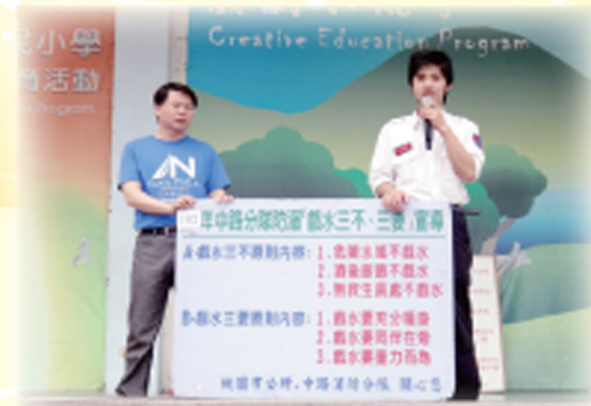
結合桃園市公所-中路消防分隊辦理學生「消防急救宣講」