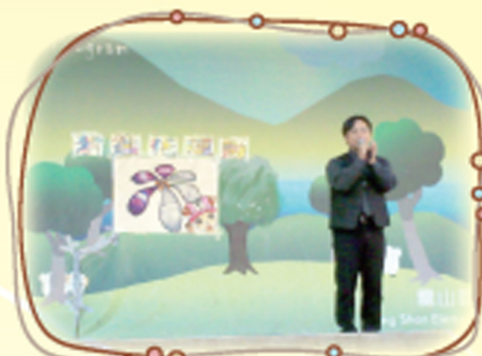
紫蝶花運動開始了！ 校長為師生說明紫蝶花的意義