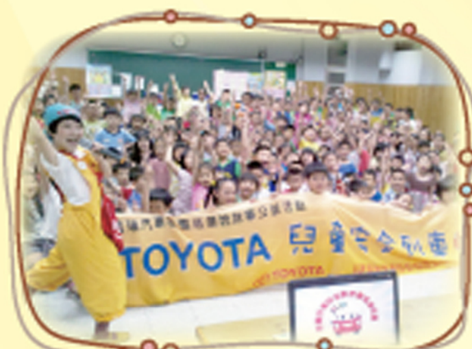
本校邀請TOYOTA說故事姐姐到校 為小朋友做交通安全宣導