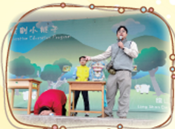
落實防災防演練與宣導