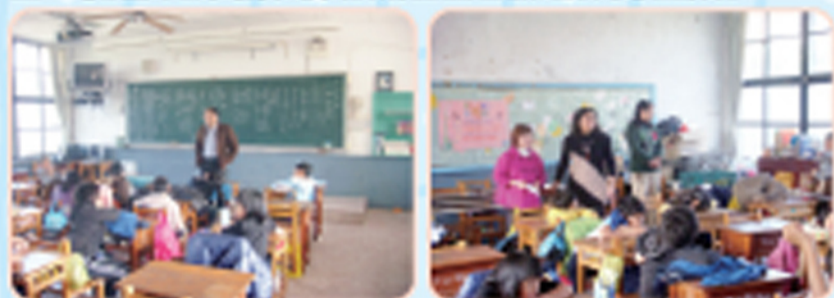
妙法輪基金會課後照顧班開班，教務主任主持開班典禮