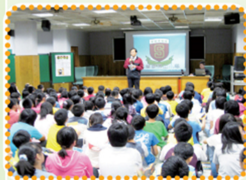
新興中學師長的介紹該校特色