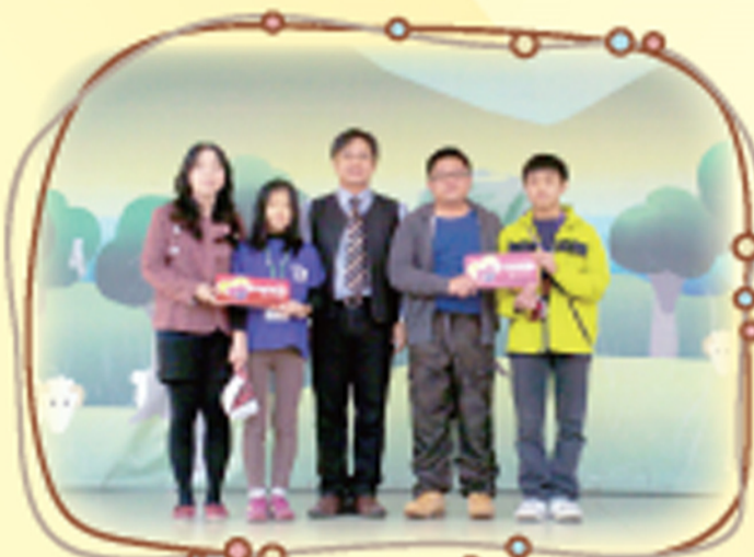
校長親領桃園縣心三美 優選班級獎牌給獲獎師生