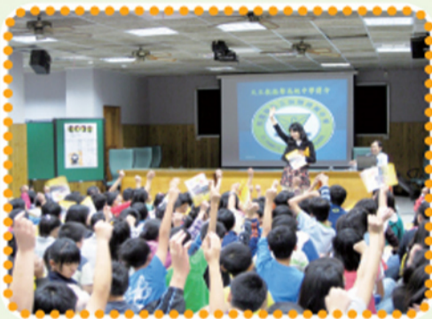
振聲中學有獎徵答方式讓學生更興奮