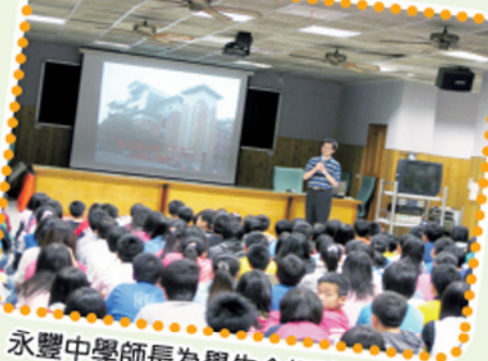
永豐中學師長為學生介紹該校特色