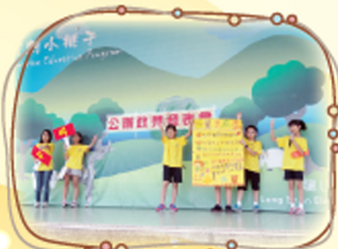
第21屆自治市公辦政見會 各級候選人在司令台上發表