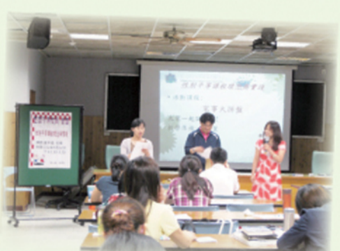
帶入活動讓課程更輕鬆