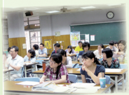
教師踴躍參與研習增進知能