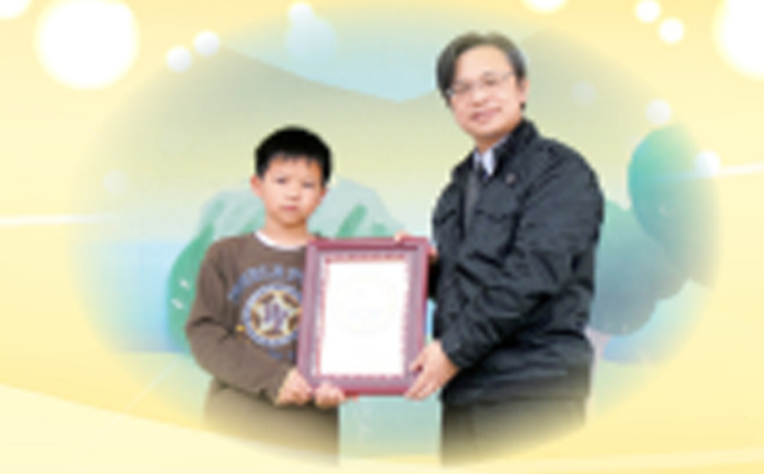
本校榮獲101學年度游泳檢測績優學校