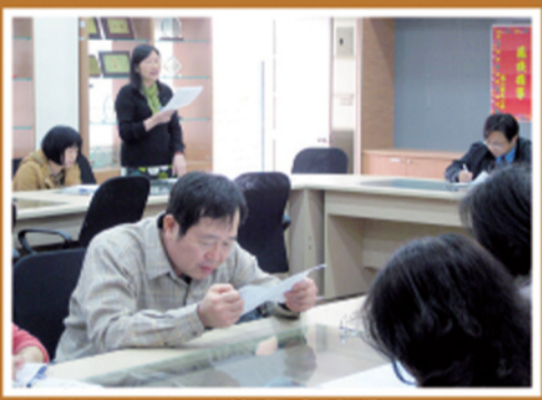
輔導組長執行特教業務說明