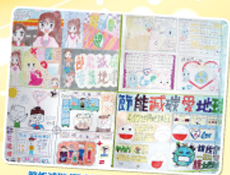
節能減碳(競賽)繪畫比賽得獎作品欣賞