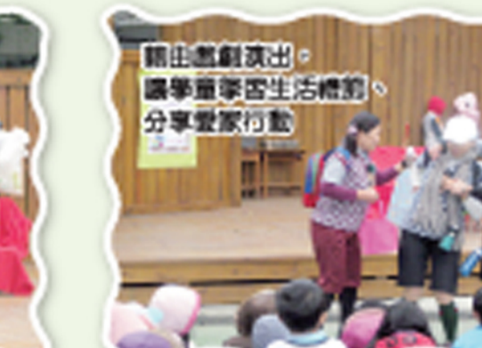
藉由戲劇演出， 讓學童學習生活禮節， 分享愛家行動