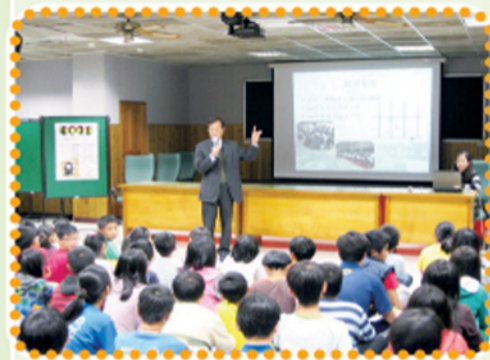
有得中學校長說明學校特色