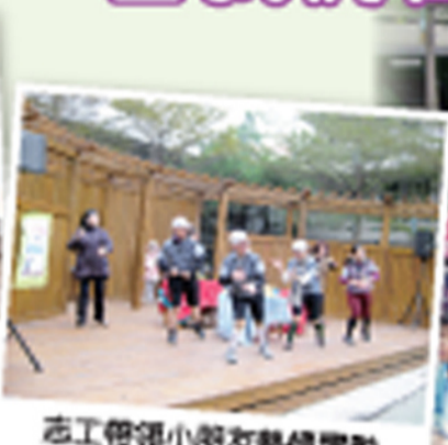
志工帶領小朋友熱情帶動