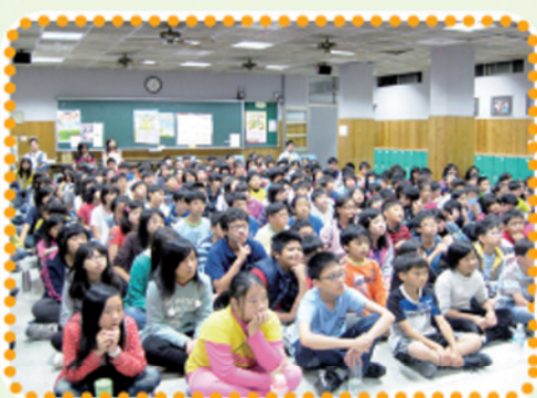
六年級學生個個聽得興致勃勃