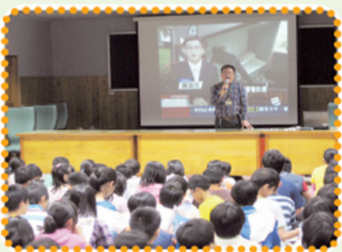
慧燈中學的傳承與特色