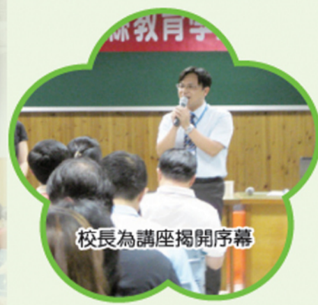
校長為講座揭開序幕