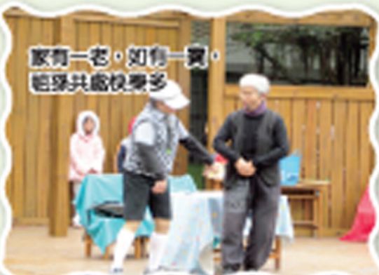
家有一老，如有一寶。 紐穿共處快樂多。