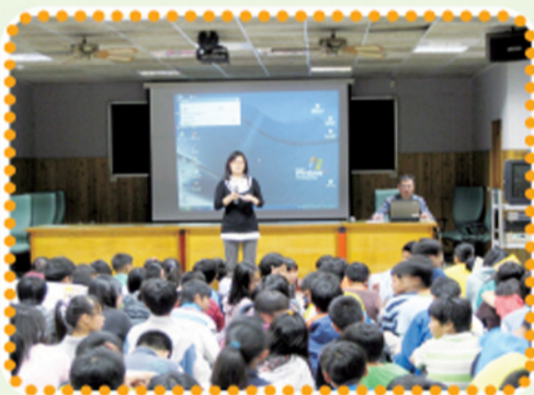
輔導主任為升學講座揭開序幕