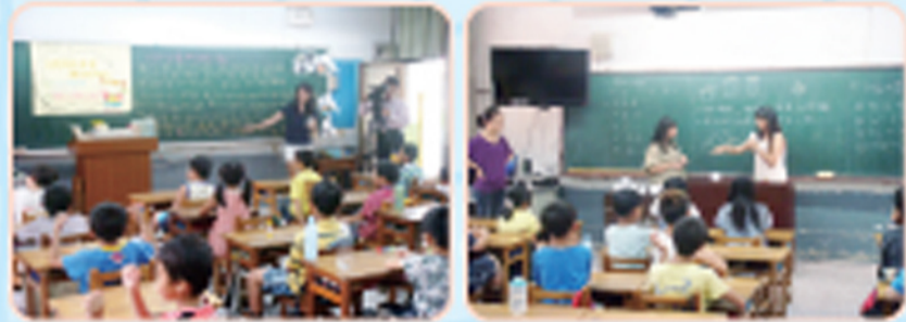
基金會講師課程設計活潑有趣，寓教於樂，學生學習認真、有效率