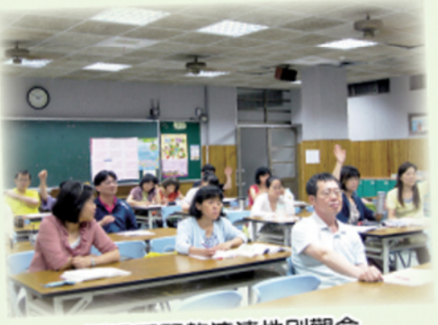
透過研習釐清性別觀念