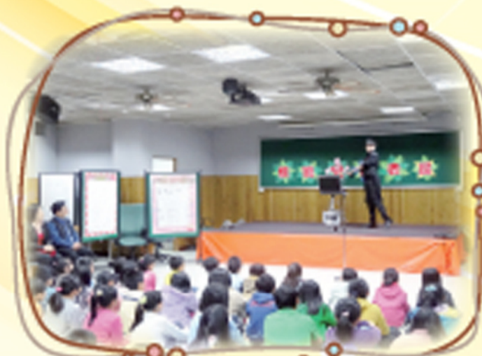
本校魔術社團林老師 在模範兒童表演大會中的精采表演