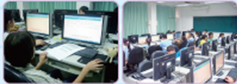
攜手計畫班學習成長線上活動，同學們聚精會神努力作答