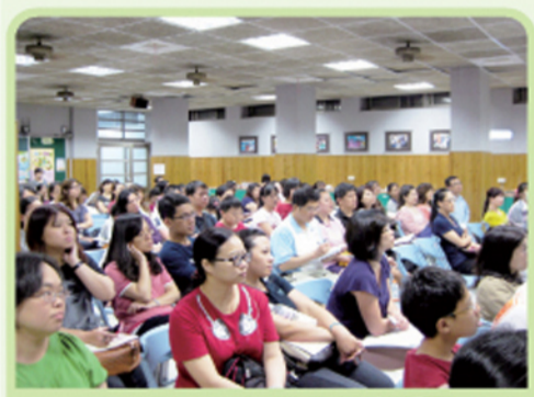
家長對十二年國教相當重視與關心積極提問