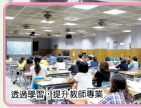
透過學習，提升教師專業