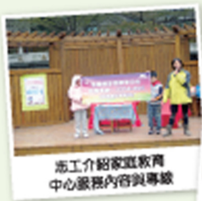
志工介紹家庭教育 中心服務內容與專線