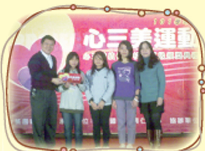
本校601、607榮獲 101學年桃園縣心三美優選班級