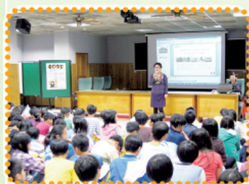
大華中學師長的介紹該校特色