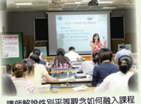
講師解說性別平等觀念如何融入課程