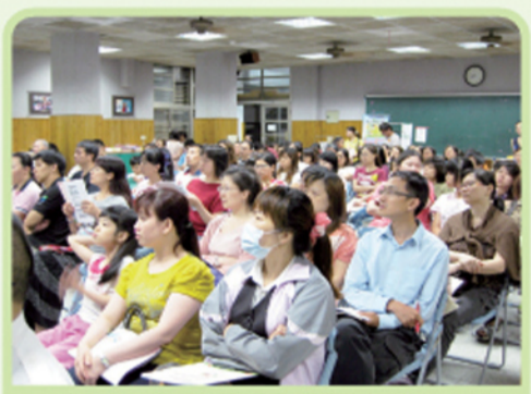
家長踴躍參與講座