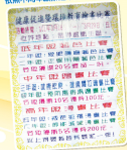
傳染病宣導比賽得獎作品