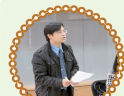
校長主持特推會會議 —積極推動特教工作