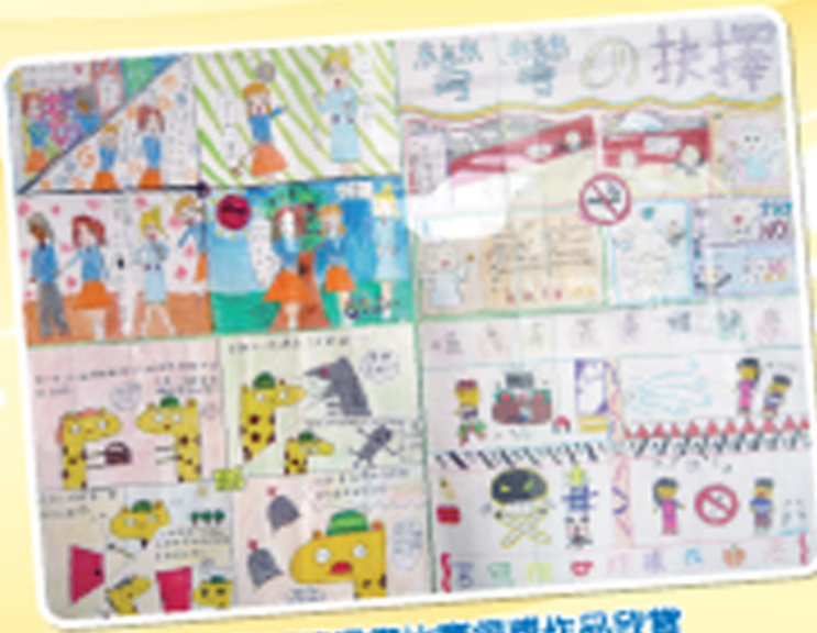
成菸拒檳繪畫比賽得獎作品欣賞