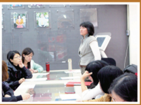
導師提出個案需求會議中討論