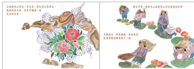
※範例作品：教育部反毒繪本—山茶花婆婆/洪孟真、呂舒婷