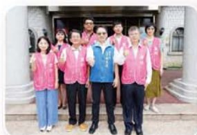
新北市蘆洲區公所—以人為本，創造共榮、 宜居(友善環境、健康、高齡友善、文化、安全)的新、心蘆洲

打造「亞洲新灣區」，帶動城市轉變；透過國際競圖徵選，結合綠色建築概念，並建構多項全球首創之建築工法，打造國際水準地標建築；另增加溝通協調及介面整合，全面管控施工品質，成為綠色公共建築新典範。